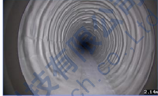
全景管壁裂缝图，裂缝宽度0.1~0.2mm

武汉天宸伟业物探科技有限公司 Wuhan Tensense Geotech Co., Ltd.